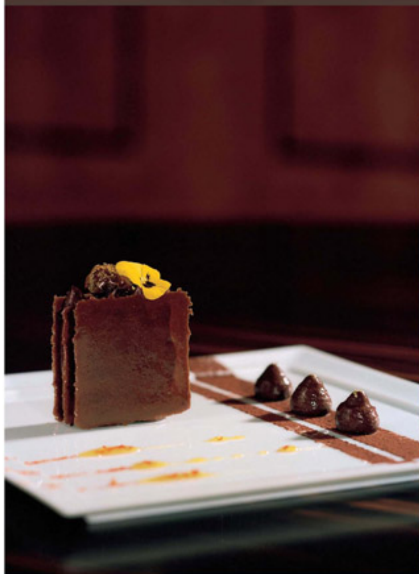
GUANAJA-CREME MIT SCHOKOLADENKARAMELL UND ORANGEN-CHILI-JUS